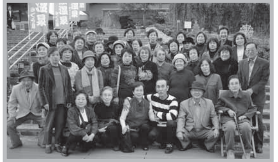
— ふれあいネットワーク企救丘研修旅行 — 平成22年11月25日大任町さくら街道で

* スローガンは「声かけて子どもの育つ企救丘」 「ふれあいネットワーク企救丘」は、「ふれあいネットワーク活動推進事業」の一環として、一人暮らしの高齢者との研修旅行を行っています。町内会長、民生委員、福祉協力員が、一人暮らしの高齢者と共にバス2台に分乗して日帰り研修旅行を実施し絆を深めています。