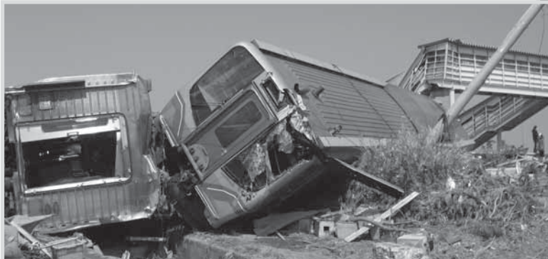
JR常磐線、福島県新地駅構内（4月）

として新たな生活基盤を求めて、北九州市に転居された方々を温かく迎える取り組みも行われています。