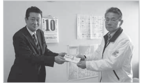
— 宮川支店長様(左)より —

守恒支店では、行員の皆さまの地域に根ざした社会貢献活動の一環として、開店14周年の記念寄付(平成19年)をはじめ、毎年、ご寄付をいただいております。