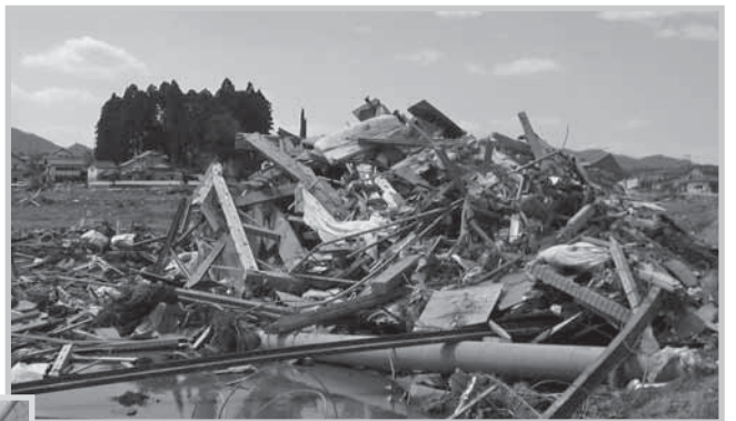
福島県相馬郡新地町役場前、新興住宅地（4月）

北九州市においても、自ら現地に出向いて、被災者を支援する活動のみならず、『絆』プロジェクト北九州』