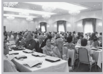
— 富士見ホールでの敬老会 —