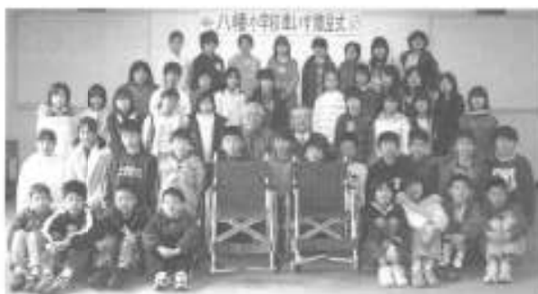
贈呈式 社会福祉センターにて

つことを学習しました。 各家庭より空き缶やブルタプを持ち寄り、収集の協力を校区内の区役所や市民センター、地域の皆さんにも呼びかけ、目標の120kg(ドラム缶一缶)を超え130kg収集し、今回車いすを2台購入することができました。