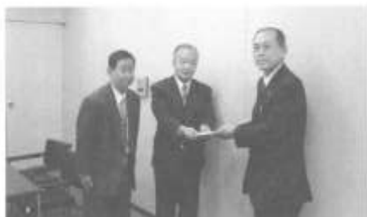
「福祉に役立てて！」福岡ひびき信用金庫(左)より

1月29日、福岡ひびき信用金庫(古川青史理事長)から寄付をいただきました。同金庫では、職員で結成する「イングスクラブ」のみならず、さまざまな社会貢献活動に取り組んでおり、今回の寄付金は、その一環として街頭で募金活動されたものと、同金庫の各支店に設置された募金箱に集まったご芳志に、同金庫職員からの寄付金を併せてお持ちいただきました。ありがとうございます。