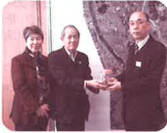
光貞校区社会福祉協議会

3月8日に開催された「一人暮らし年長者交歓会」において、実演された「バナナのたぎ売り」の売上金を義援金として贈呈されました。