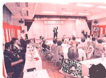
一人暮らし年長者行事