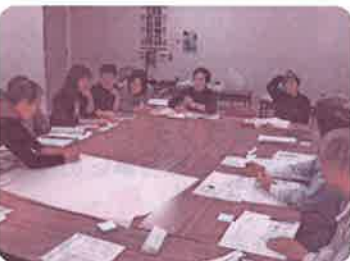
小地域福祉活動計画づくり