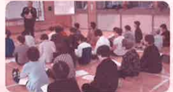
本城校区社協 健康と福祉のまちづくり講座(ステップII)

皆様のご芳志は、校(地)区社会福祉協議会の実施する地域福祉活動を通じ、子どもから年長者、障がいのある方、一人親世帯などで支援を必要としている方を支えるための活動財源として有意義に活用させていただきます。