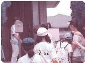
ウェルクラブ活動