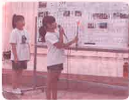
活動成果発表の様子