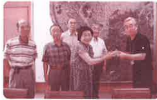
誕生会の募金を頂きました。