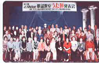
第25回発表会のチャリティー募金を頂きました。