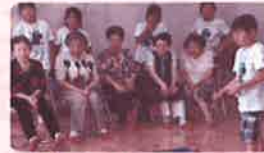
年長者サロン「なかよし広場」との交流

赤坂校区ウエルクラブの子どもたち(15名)は、夏休みに福祉協力員のサポートを受けながら、年長者宅の見守り訪問や地域清掃などのボランティア活動体験を行いました。