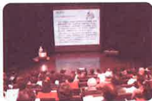
福祉協力員等合同研修会