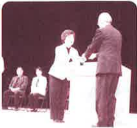
八幡西区婦人会連絡協議会