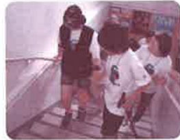
ウエルクラブ活動