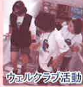
ウエルクラブ活動

ふれあいネットワーク活動推進事業をはじめ、年長者いきいきふれあいサロン・子育てサロン活動、次世代を担う子ども達を対象とした福祉体験学習ウエルクラブ活動など様々な福祉活動が各校(地)区社協で取り組まれています。