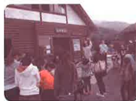
ひとり親世帯ふれあいバスハイク

○地域福祉関係団体との連携・調整 ・区民生委員児童委員協議会事務局業務の受託 ・ひとり親世帯ふれあいバスハイクの実施（25組58名参加） ・年長者作品展の実施（出展作品数238点）