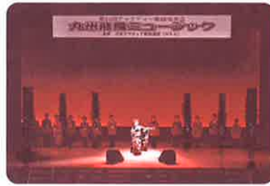
第24回チャリティー歌謡発表会の益金として