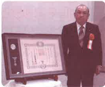
瑞宝単光章受章を記念して