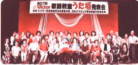
第27回発表会のチャリティー募金を頂きました

みなさまの「芳志は、各校(地)区社会福祉協議会の実施する地域福祉活動を通して」もから年長者、障害のある方、ひとり親世帯などで支援を必要とする方を支えるための活動財源として有意義に活用させていただいております。