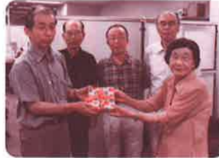
誕生会の募金を頂きました