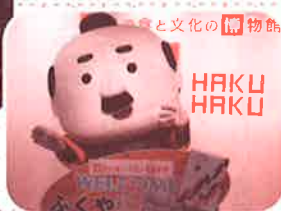
ハクハクのゆるキャラ「かわりみ千兵衛」