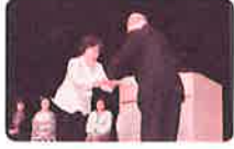
第32回チャリティ芸能まつり寄付贈呈式

八幡西区婦人会連絡協議会よりチャリティ芸能まつりにおいて、毎年ご寄付いただいています。