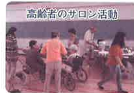
高齢者のサロン活動