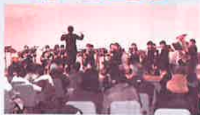
自由ヶ丘高校 吹奏楽部による 若さあふれるエネルギーな 演奏で盛り上げて下さいました！