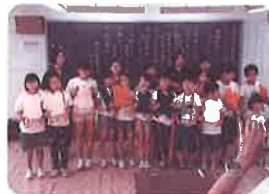
ウェルクラブ活動