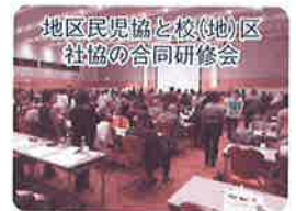
地区民児協と校(地)区社協の合同研修会