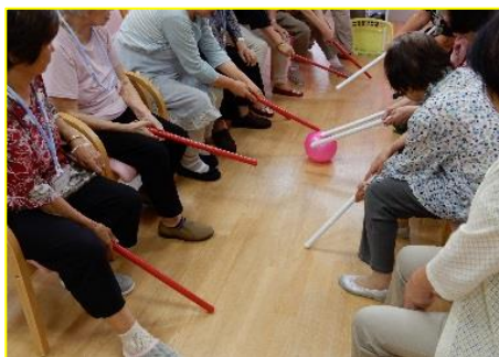
利用者さんと一緒に棒サッカー☆

この日は、運動レクで利用者さんと棒サッカーに挑戦し、7 対 7 で繰り広げられるゲームは白熱したものとなりました！