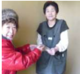
ご主人長期入院で独居、初訪問(77歳)