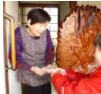
今年ご主人亡くされ独居になったばかり。初訪問(77歳)