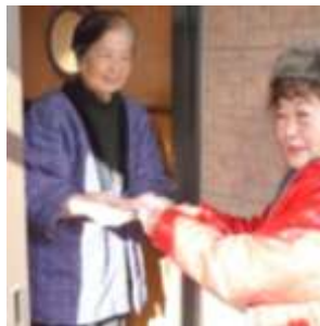
“外出もでき元気です”(81歳)