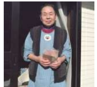
“いつもお世話になります。センタークラブに参加して元気です”(78歳)