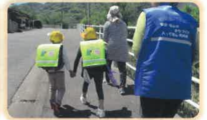
パトロール隊：ほら！新芽が出るとよ！ 子どもたち：なんの芽？ パトロール隊：グミの実がなるんよ 子どもたち：え！？あのお菓子のグミ??? パトロール隊：（爆笑）