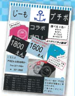
フチボとじーものコラボ