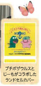
プチボザウルスと じーもがコラボした ランドセルカバー