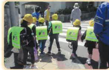
地域のみんで子どもたちの安全を 見守っています