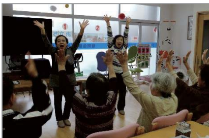
お口の体操〜最後は大きな声で!

「リンクケアセンター八幡」は今年7月にオープンされたばかりのデイサービスで、初めて活動者を迎えた11月20日に取材に伺いました。活動者は、長年のボランティア経験から、プログラムには必ず利用者が参加できるものを取り入れ、活動中には、利用者への尊敬の気持ち・学ぶ気持ちを忘れないよう心掛けていらっしゃるそうです。この日はキャッチボール・輪唱などで利用者との交流を深めたあと紙芝居が始まり、みなさん終始笑顔で和やかな、あっという間の1時間でした。