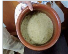
入居者自慢の 床漬けを拝見