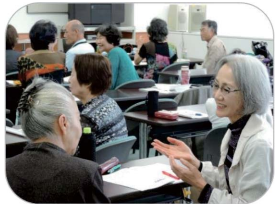
～傾聴タイム中～ 楽しそうにお話しをしています。