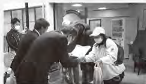
曾根東校区社会福祉協議会(好日苑訪問活動)

ウェルクラブ活動に取り組む曾根東校区では、児童に呼びかけ「折り鶴と絵手紙」を書いてもらい、感染予防のため、校区社協役員が児童の代理で施設に届けました。