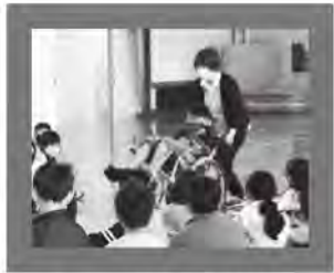
↑車いす体験学習では実際に車いすに乗ったり操作したりします。