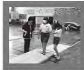
↑視覚障害者疑似体験学習は、アイマスクを着けて行います。

小倉南区内小・中学校や各校(地)区社会福祉協議会が進める福祉教育の取り組みへの支援を行っています。