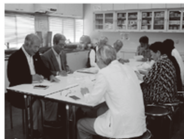
小地域福祉活動計画づくり (若園校区社協)

本年度は、若園・徳力・長行の各校区社協で、新たな計画づくりの取り組みが始まります。