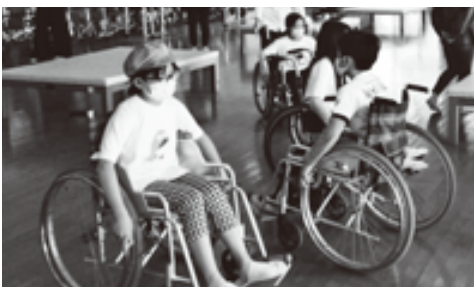
ウェルクラブ活動(葛原ウェルクラブ)