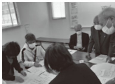
話し合い活動 (若園校区社会福祉協議会)

「共同募金」ならびに「歳末たすけあい募金」にご協力をいただき、まことにありがとうございました。 社会福祉協議会の活動の多くは、共同募金と皆さまからの温かい寄付やチャリティーに支えられています。