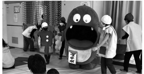
両谷市民センターに遊びに行ってきました。