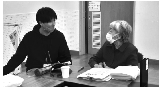
集いの場サロンで1人住まいの高齢者が生活の不安を相談(ふれあい広場若園)