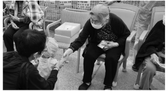
小さな子供と触れ合えて嬉しそうな高齢者の方たち