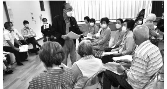
沼校区 見守り活動 話し合いの場 (町内会長や民生委員と福祉協力員の連携会議)