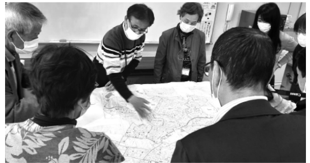
災害に備えた福祉マップ勉強会