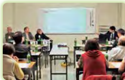
◀平成30年7月豪雨災害 体験報告会

令和2年度もこの講座を2校区社協で実施します。ぜひあなたのまちでも「ふだんのくらしをしあわせにする『ふくしのまちづくり講座』」を開催してみませんか？