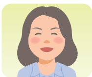
にげ 二家 絵梨子