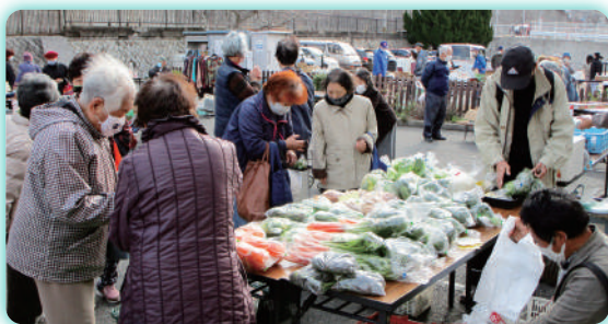
▲100回記念 ふれあい朝市