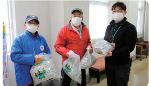
▲錦町校区の皆さん