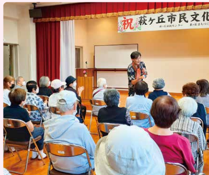
▲萩ヶ丘校区「ひまわりサロン」