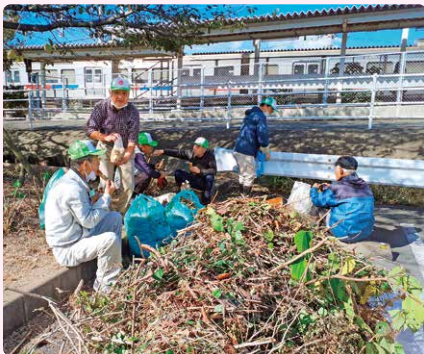
▲小森江西校区「小西安心お助け隊」

赤い羽根共同募金は戦後昭和22年に始まり、当時は家や家族を失った子どもたちの支援のために役立てられました。それから76年。現在では高齢者や障害者、ひとり親世帯などの支援、地域交流、また大規模災害時にはボランティア活動の支援にも役立てられています。