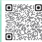
終活あんしんセンター