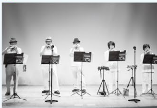
5名でオカリナの演奏を披露しました