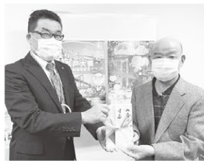
若戸大橋 国重要文化財指定記念イベント 戸畑区役所 有志一同様