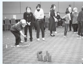
フィンランド発祥の木の棒(モルック)を投げて点数を競うゲームを楽しみました