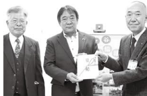
3R活動推進賞「EMエコ石けん」売上金 鞘ヶ谷まちづくり協議会様