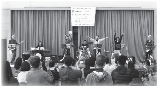
コロナ禍以前の活動の様子