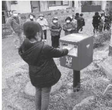
(赤崎小学校の様子)