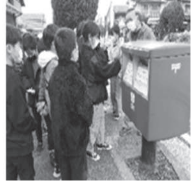
(小石小学校の様子)