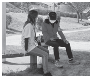
認知症になっても 住み良い地域へ (声掛け訓練)

赤い羽根共同募金による皆さんからの思いやりの心が、普段の暮らしや地域を支える活動につながっているんだね。でも上記のような活動は誰がしてくれているんだろう？