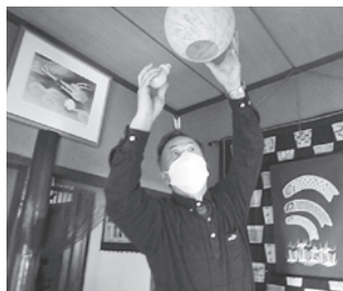
助け合い活動 (困りごと支援)