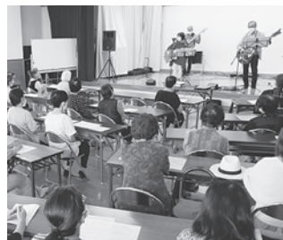
地域の居場所 サロン活動