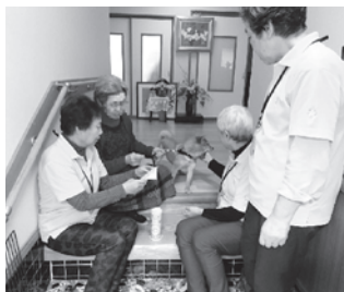
気になる方へ 見守り訪問