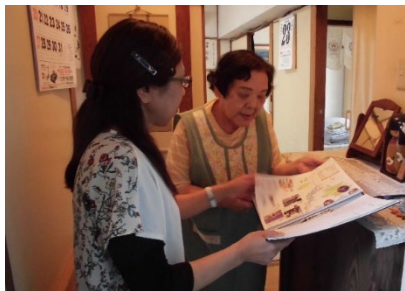
見守り訪問では生活に役立つ情報が共有されます

大蔵第三地区では平成21年(2009年)より、気になる世帯をより細かく見守れるよう福祉協力員の他、各町内エリアに『ふれあい推進員』を配置し「ふれあいネットワーク活動」(見守り・話し合い・助け合い)の充実を図り、社協・民生委員・老人クラブが三位一体となり、活動を推進してきました。