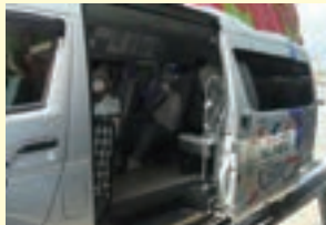
▶乗合ジャンボタクシー

これからも地域の皆様に愛される“人と人をつなぐ乗り物”として、安全運行してまいります。