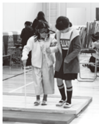
視覚障害者疑似体験

体験を通し、「目かくして歩くのはこわい」「車いすで段差を超えるのは難しい」などの不自由さを実感した子ども達が、自分達に何が出来るかを考える事で、温かい“福祉のこころ”が育っています。