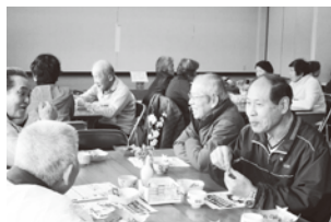
『稲穂の会』 東谷地区