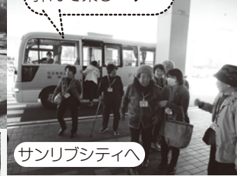
サンリブシティへ

ご協力いただいた、 特別養護老人ホーム 美咲ヶ丘(社会福祉法 人 敬寿会)の方にイン タビュー!