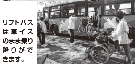
リフトバスは車イスのまま乗り降りができます。