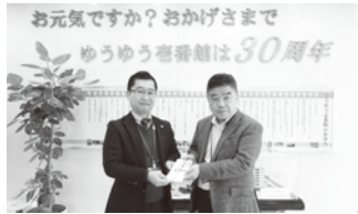
ゆうゆう壺番館様(左)