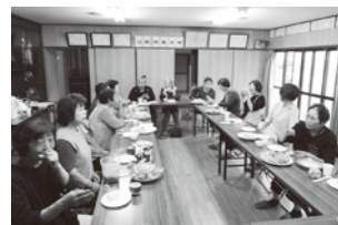
『おしゃべり広場』 田原校区