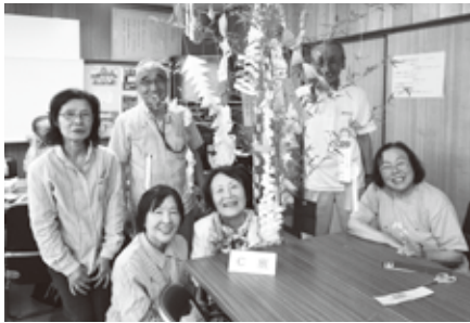
吉田校区サロン「とぎの会」