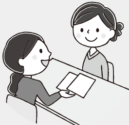
↑ボランティアコーディネーター