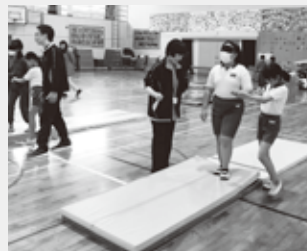
↑視覚障害者疑似体験学習は、アイマスクを着けて行います。

小倉南区内の小・中学校や、各校(地)区社会福祉協議会が進める福祉教育の取り組みへの支援を行っています。