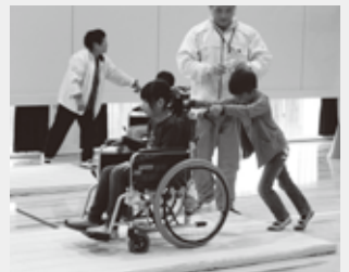
↑車いす体験学習では実際に車いすに乗ったり操作したりします。