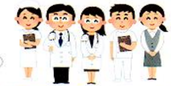
介護保険サービス事業者や医療機関との連携