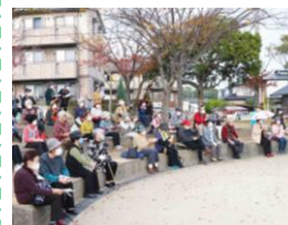
公演観覧席には間隔をあけて座ってもら