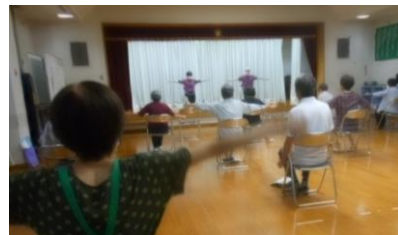
ロコモ体操十分距離を保って行っています

ほのぼのサロンは今年度で9年目になりました。4月から新型コロナウイルス感染症拡大防止により活動を休んでいましたが、検温・手指消毒・マスク着用などのコロナ対策を取りながら、7月6日に今年度第1回目を再開しました。活動も香月会長のお話と軽い体操（ひまわり太極拳やきたきゅう体操、生活アクティブ体操等）で身体を動かし、1時間程度でサロン終了となるよう組み立てています。11月は「とびうめ@きたきゅう」と「バランスの良い食生活について」、専門家を招いてお話を聞きました。この先もコロナ対策をとりながらの活動だと思っています。興味のある方、毎月第1月曜日、午前10時より高須市民センター講堂です。お気軽に見学だけでもどうぞ！