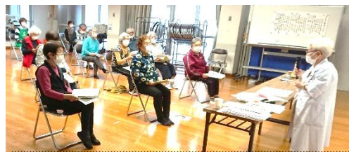
管理栄養士 足立先生による栄養指導