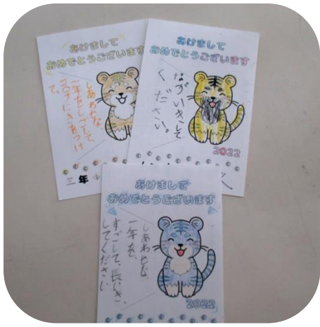
中尾コスモ児童クラブの児童が 年長者年賀状を作成してくれました。