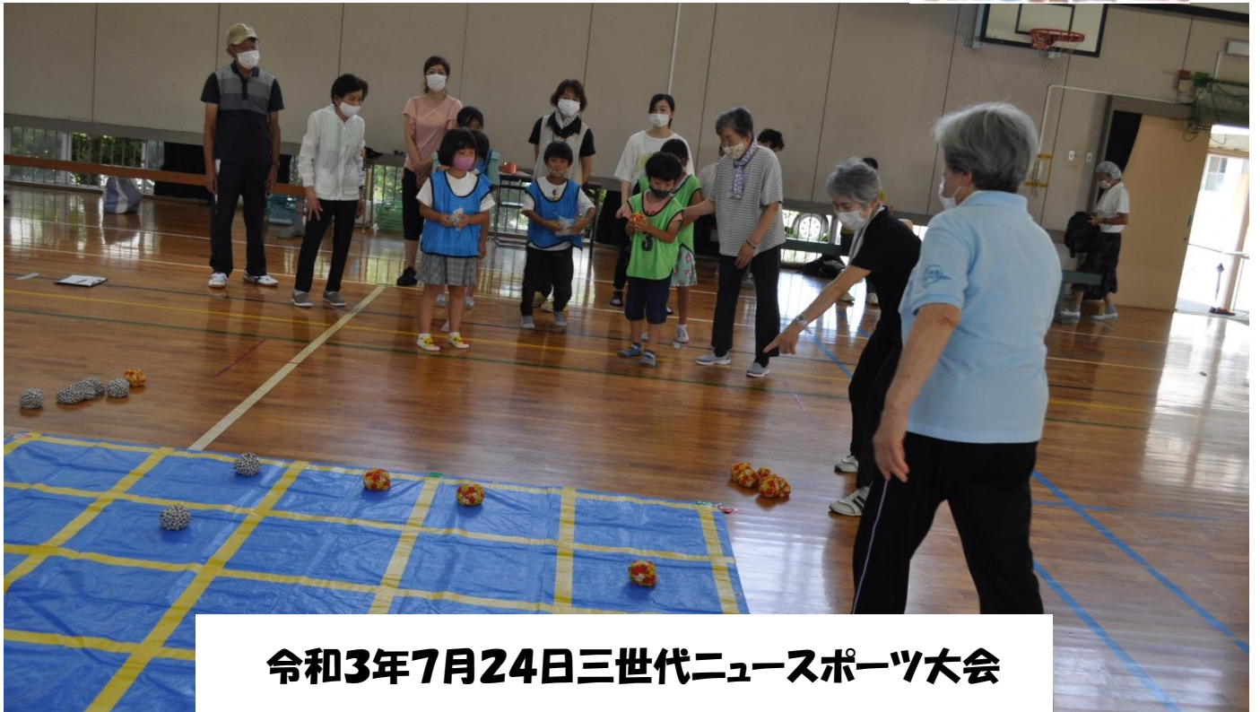
令和3年7月24日三世代ニュースポーツ大会