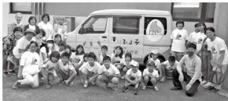
チームワークばつぐんの北小倉おたすけマン