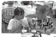
次世代地域福祉活動者育成事業(ウエルクラブ)