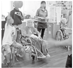
子どもたちの訪問に大喜び！ 笑顔があふれます

1日目は、泉台小学校図書室で、福祉(㊤)だんの(㊦)らしを(㊧)あわせに)について勉強。できる範囲のちよこっつとボランティア『ちよこボラ』について学んだ後は、高齢者疑似体験と車いすの体験も。「お年寄りつてこんなに大変なんだ。」「車椅子の乗り心地は良くないね。」など、支える側と支えられる側の両方を体験しました。