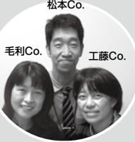
松本Co. 毛利Co. 工藤Co.