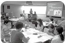
福祉活動者の養成研修会

赤い羽根共同募金と企業(店舗)が協力し、「寄付つき商品」を企画することで、企業利益と社会貢献をつなげる取り組みははじまっています。小倉北区では「赤い羽根龍之介」