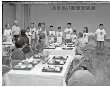
まずはあいさつと自己紹介から ちよっぴり緊張気味？

富野校区ウエルクラブは、夏休みをひかえた7月12日、富野小学校の校長先生のあいさつから始まりました。続いて、「ふくしつてなに？」『高齢者お手伝いのポイント』などの福祉の勉強を終えた後、ウエルクラブ児童に任命された子どもたちは、ちよっぴりと照れくさそうにしながらも、頑張って活動することを誓ってくれました。