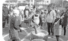
多世代交流 ふくし餅つき大会

カレー」の瑞璃ズキッチン小倉砂津店と「地域の安全を守る見守りカメラ」のセイフティテクノサービス㈱の2社が募金協力を行っています。ご家庭で、職場で、学校で、「共同募金」はいつでもどこでも参加できるボランティア活動です。