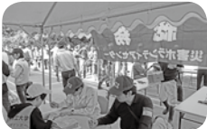
災害ボランティアセンターの設置・運営