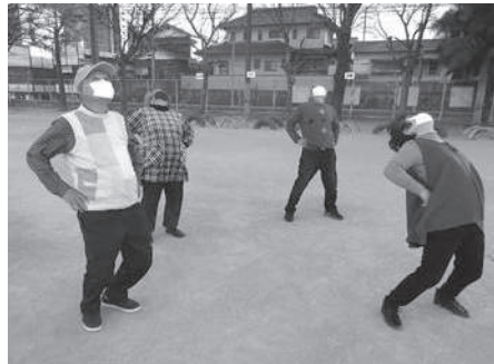
体を動かして気分リフレッシュ

い込みます。久しぶりに体を動か して、心も体もすっきり晴れ晴 れ!体を動かすことは、自粛疲れ で弱った心と体をリフレッシュさ せてくれます。 また、「黒住1・4新黒住地 区」では感染防止対策を十分に図 りながら公民館に集まり、久し ぶりのおしゃべりとクリスマスツリ ー作りを楽しみました。 コロナ禍の今、普段よりもさら に地域で孤立しがちな高齢者にと つて、だれでも気軽に参加できる サロンは、人との繋がりがやふれあ いを身近に感じることの出来る場 です。これまで築いてきた地域の 絆や助け合いの関係を絶やすこと