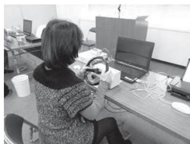
自分のテクニックを過信していたなあ…