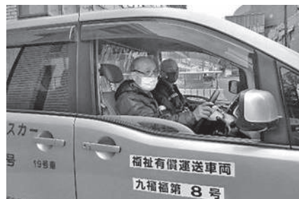
今日も安全運転を！