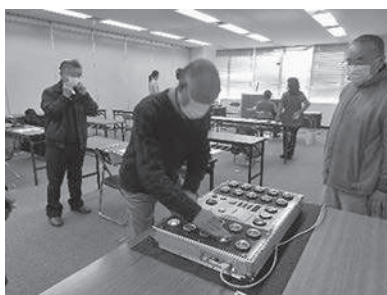
反射能力が実年齢より若かったので嬉しい！

小倉北警察署や交通安全センターの講師による運転シミュレーターや計測器を使ったの実技研修では、事故を未然に防ぐためには、自身の運転テクニックを過信せず、車間距離を十分にとることなど、安全運転の心得を学び、初心に戻ることができました。