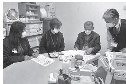
出発前のミーティング！

新型コロナウイルス感染症拡大防止により自粛していた「送迎事業」を9月から再開しました。感染予防に十分配慮し、利用者の期待に応えた送迎スタッフに、スポット！