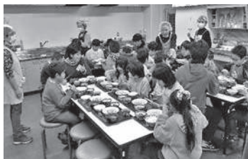
“おいしい”の一言が幸せ