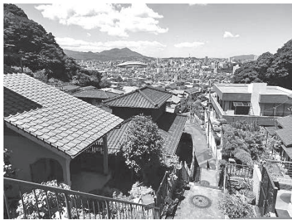
坂の上からの眺望は最高！

富野校区は足立山の麓に位置し、春は桜並木、秋は紅葉と自然環境に恵まれた地域です。その傾斜地にある小文字園地区の名物といえば、お盆の迎え火「小文字焼き」と「坂道」。小文字園はどこをとっても坂と階段！小文字焼きが小倉の街から美しく見えるのも、この傾斜のおかげかもしれません。住民にとってはこの坂道の上下りが歳を重ねるごとに段々辛くなってきました。地区の高齢化が進み、今までは自分で出