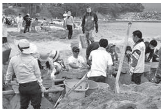
美しいふるさとの海を守りたい