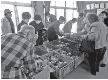
旬の食材が勢ぞろい 今日の夕飯は何にしよう♪

く、参加者の皆さんは一齐にお目当てるものを目にかけて駆け出しま す。大盛り上がりの参加者のみな さんの密を避けるのは一苦労でし たが、それでもお世話役の民生委 員さんや福祉協力員さんはこの盛 況ぶりに心から嬉しそうです。 「この野菜は安くて新鮮なも のが多いので、つい買いすぎてし まったわ」と、少し照れた笑顔で 膨れた買い物袋を見せてくれる 方。「久しぶりにみんなと顔を合 わせてお話ができたので、元気に なったわ」と、嬉しそうにお話 してくれる方。参加者の皆さんは大 満足で集会所を後にしました。 「高齢者にとつて、重い荷物を 持つて坂を上るのはとても大変。 また、今年は地域の行事や見守り 訪問活動もほとんどできず、安否 確認も難しい状況が続いていた。 このふれあい朝市&サロンを通し