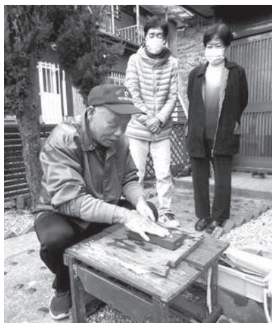
慣れた手つきで包丁をびかびかに研いでいきます

来ていることが難しく感じるようになった人や、買い物や家事など日常生活に不便を感じる人が増えています。また、住民同士のつながりが希薄化するなかで、地域での助け合いも難しくなってきました。