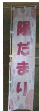
このぼりが 目印です!