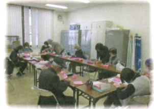
ボランティアルーム活動風景