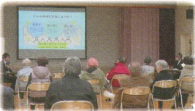
↑尾倉第二地区 第二回の様子