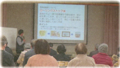
↑尾倉第四地区 第一回の様子