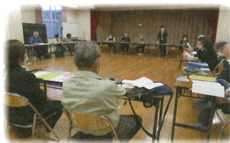
↑会議での話し合いの様子

見守り活動等の中でわかった困りごと解決のために、地域住民や関係機関等で話し合います。