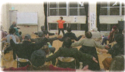
↑尾倉第四地区 第二回の様子