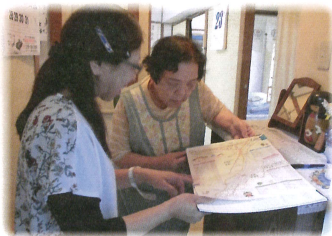
↑見守り活動の様子