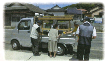
↑買い物支援の様子