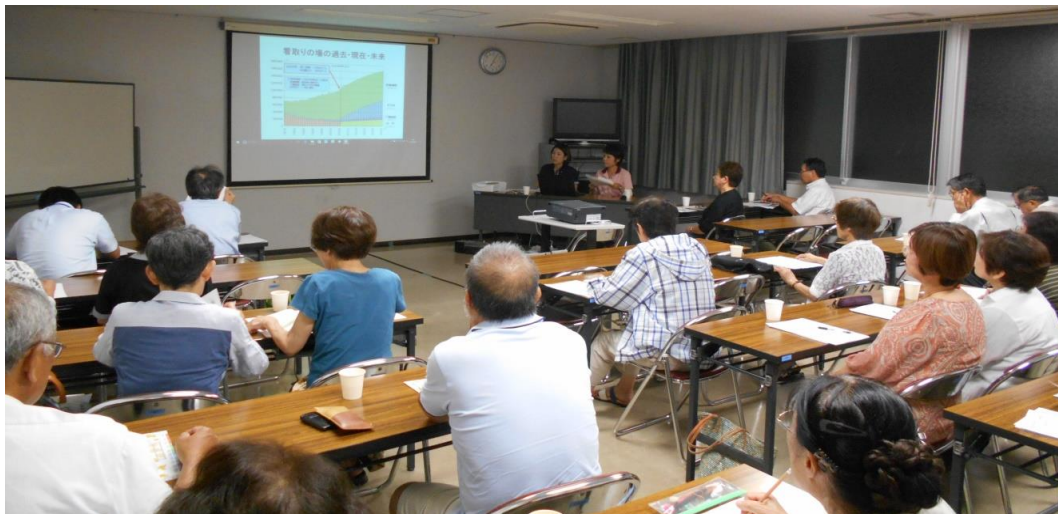
熱心に聞き入るメンバーたち